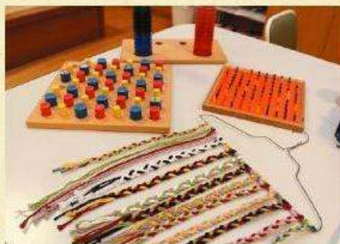
いろんな道具を使用して機能回復のお手伝いをします