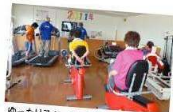
ゆったりスペースで安心トレーニング

などと不安を抱える方でも安心してご利用頂けます。むしろそういった方にごそお勧めの施設それがメディカルフィットネスなのです。