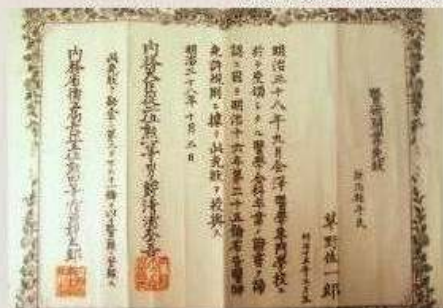
写真B 内務省開業免状