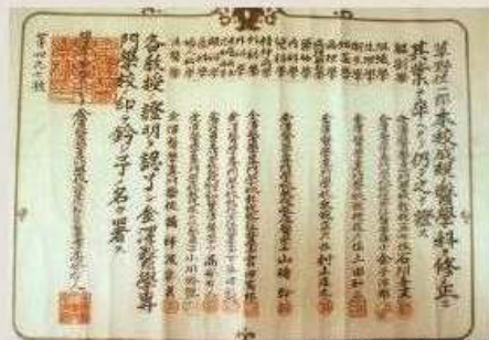
写真A 金沢医学専門学校卒業