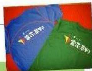
オリジナルTシャツもあります！

まずはフィットネスへお越しください。場所は富永草野クリニックの2Fです。お問い合わせはお気軽にお電話ください。 直通電話番号 32-0716