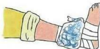
氷を用いた足首のアイシング

腫れは、腫脹(しゅちよう)ともいいますが、よく怪我の初期症状として患部にあらわれます。よって腫れは炎症性です。この場合は、患部の熱も高くなります。直接または間接的に患部を冷やし、安静を保ちながら腫れあがらないように対応する必要があります。人間の治癒力の根源は血液やリンパ液にあります。腫れが大きくなると血液やリンパ液の流れを悪くさせてしまい、なかなか治癒力を引き出す事が困難になってしまいます。怪我の後、患部周囲が腫れて熱を持っているようであれば、まずは冷やしてあげることが大変重要になります。方法としては、水囊(すいのう)や袋に敷き詰めた氷などを使い20分間程度冷やします。冷やしていて感覚が無くなってきたら20分間経過していてもアイシングを中止してください。袋の中の氷を均一に敷き詰めたり、クラッシュアイスを使用することで患部を均一に冷やすことができます。また、患部を心臓より高い位置に挙上しながらアイシングを行うと効果的です。